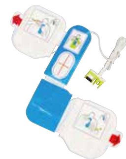
CPR-D-padz® 成人用除細動パッド 有効期限60ヶ月以上のものをご提供