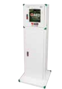
AED収納ボックススタンドセット

AED Plusを設置するためのAED収納ボックス(上)と自立型にするためのAED収納ボックス用スタンド(下)の上下を組み合わせた収納ボックススタンドセットです。