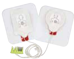
Pedi-padz™ II 小児用除細動パッド 有効期限21ヶ月以上のものをご提供