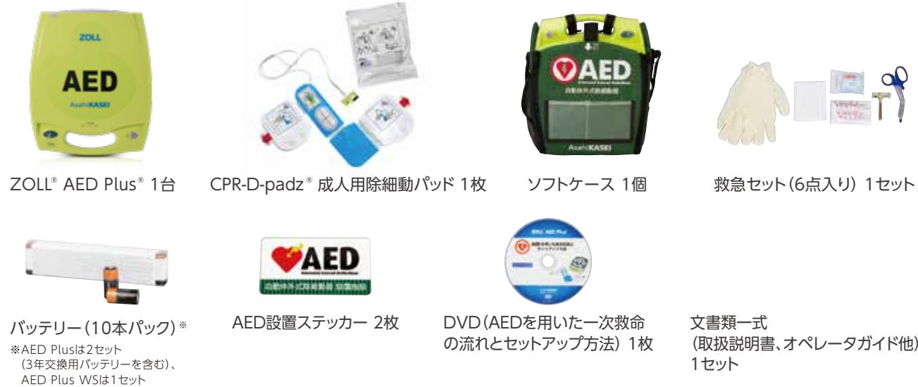
ZOLL® AED Plus® 1台