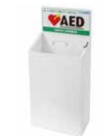
AED収納ボックス床置き型A

AED Plusを設置するための床置き型の収納ボックスです。盗難防止のため、プザーがONの間に蓋を外すとアラームが鳴ります(単4乾電池駆動)。