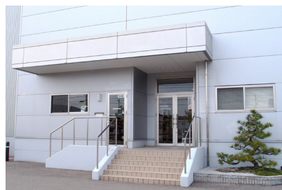
二本松物流株式会社 本社(石川県野々市市)

今回コンビニエンスストアにもZOLL AED Plusを導入しましたが、店長からの要望がきっかけでした。羽咋千里浜は、観光客が多く水難事故も発生しておりますので、設置AEDが増えることにより、お客様が使用できる可能性も増えると思い、導入を決定しました。