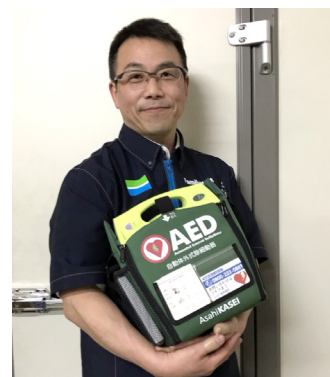
ファミリーマート羽咋千里浜インター店に設置されている ZOLL AED Plus ②