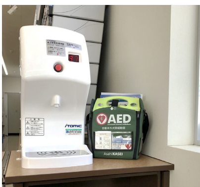
ファミリーマート羽咋千里浜インター店に設置されている ZOLL AED Plus ①

現在はまだ、コンビニエンスストアへのAEDの設置がなかなか進んでいませんが、AEDの設置が当たり前となるような日が早く来るよう、私自身も積極的に働きかけていけたらと思っています。