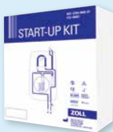
スタートアップキット